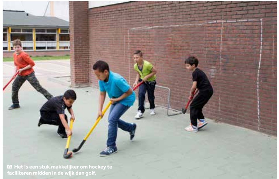
☑ Het is een stuk makkelijker om hockey te faciliteren midden in de wijk dan golf.

Coks: "Je moet worden gegrepen door het spel. Ook als kind. En daar hoort het behalen