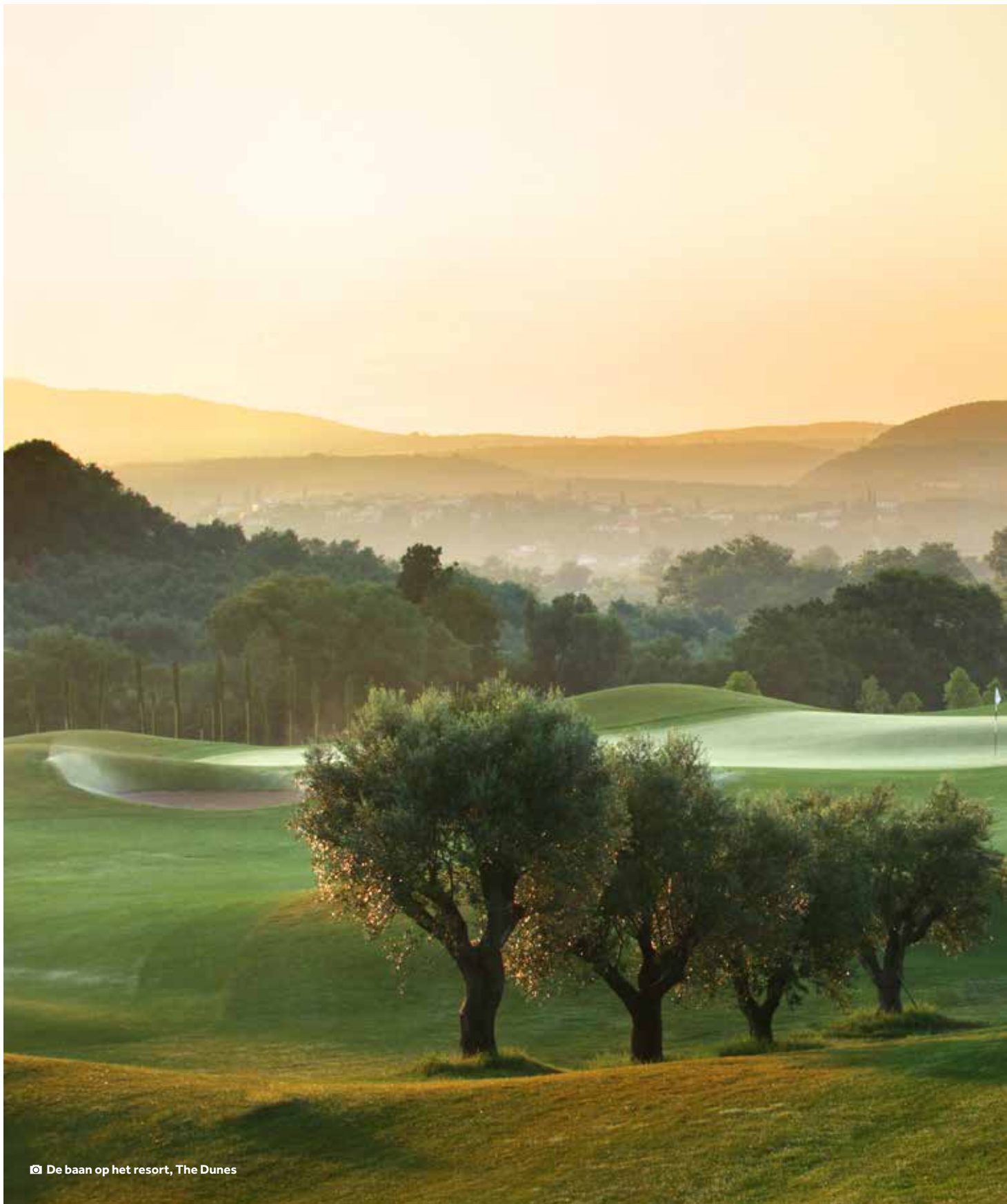
📷 De baan op het resort, The Dunes