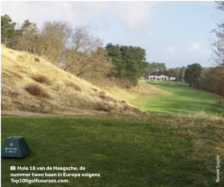
📍 Hole 18 van de Haagsche, de nummer twee baan in Europa volgens Top100golfcourses.com .