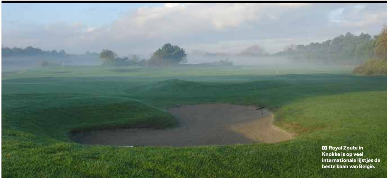
📷 Royal Zoute in Knokke is op veel internationale lijstjes de beste baan van België.