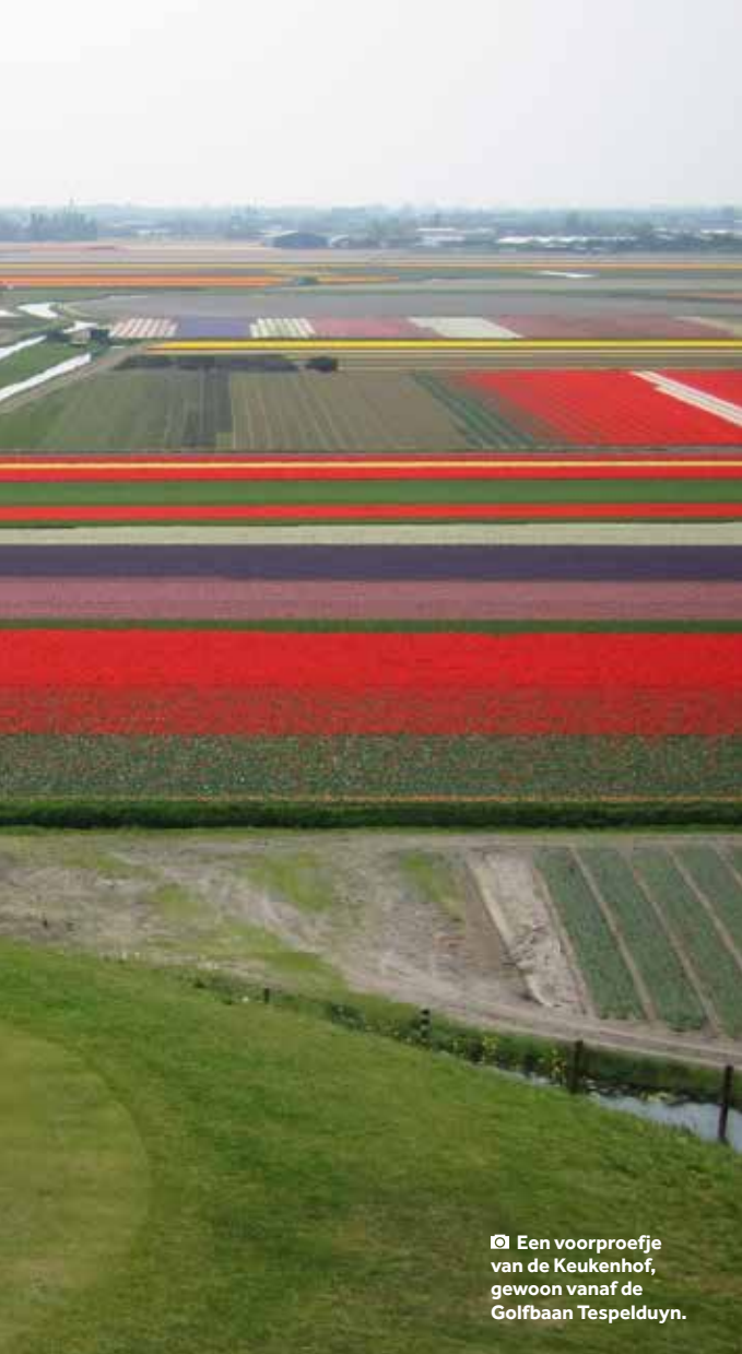
📍 Een voorproefje van de Keukenhof, gewoon vanaf de Golfbaan Tespelduyn.

nummer één golfbestemming van continentaal Europa. We denken dat dit grotendeels onontdekte golfland een van de best bewaarde geheimen is. Met 250 banen voor 400.000 geregistreerde golfers is golf big business voor de Nederlanders maar het spreekt nog niet helemaal tot de verbeelding van bezoekende golfers.”