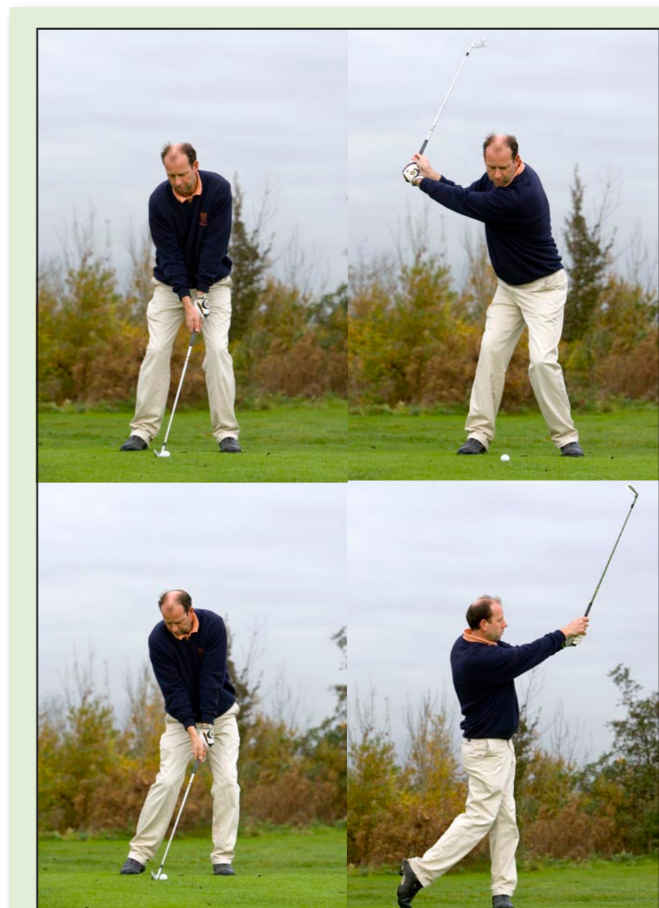
Punchslag: bal ligt in het midden, de backswing heeft 3/4 lengte evenals de finish.

Als ik spelers uit mijn selectie een volle swing zie maken met een kort ijzer tegen de wind, word ik helemaal gek. Meestal landt de bal dan dertig meter te kort.